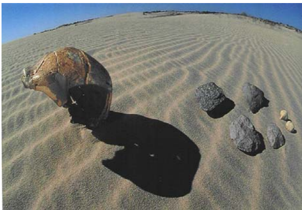
Achados fósseis na África do Sul na região desértica de Saldanha (proximidades da Cidade do Cabo)

(Fotos e desenhos veiculados pela “National Geographic”)